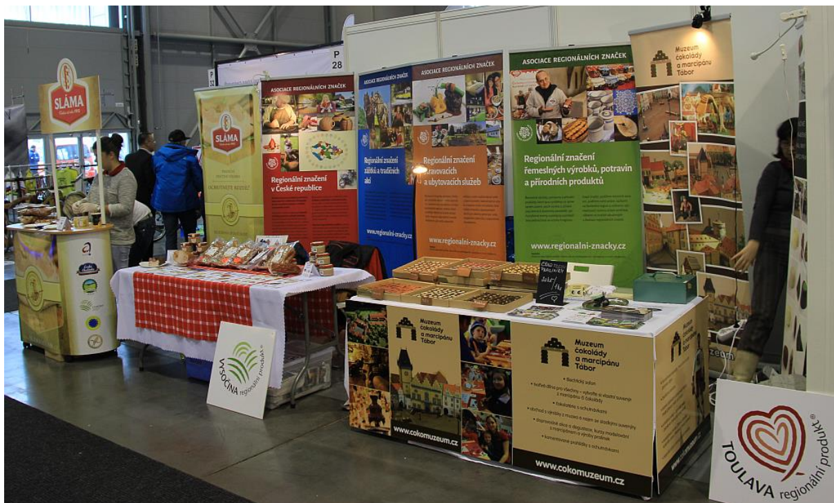
Na Zemi živitelce vystavovala ARZ v rámci prezentace Celostátní sítě pro venkov.